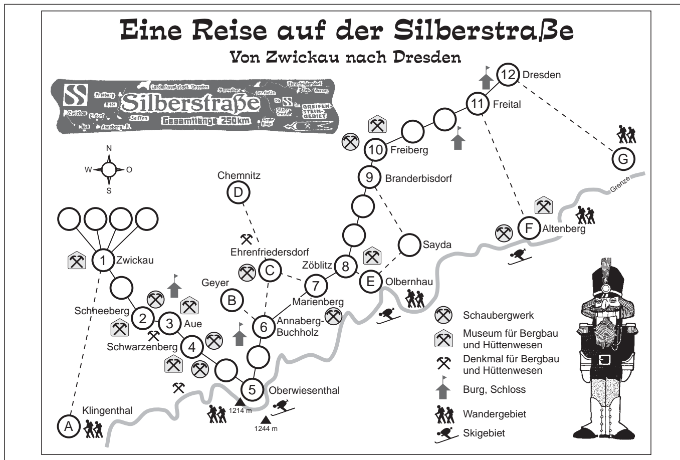
1a / 1b