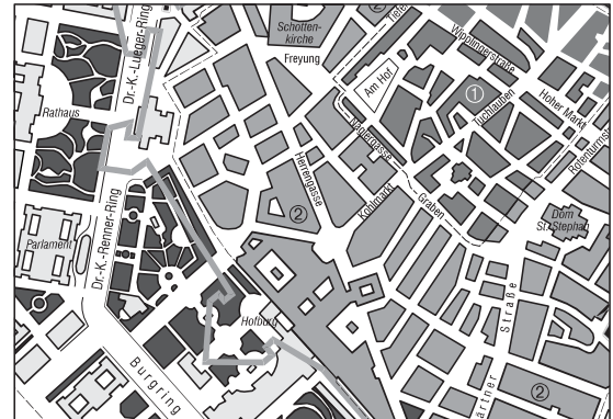
Wien, die Hauptstadt Österreichs