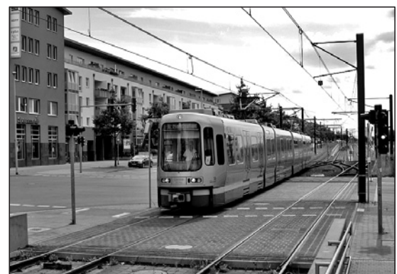
Nachhaltige Stadtentwicklung: Hannover-Kronsberg