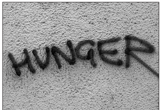
Hunger – ein zunehmendes Problem!

Aktualisierungen finden Sie auch im Internet unter www.erdkunde-medien.de