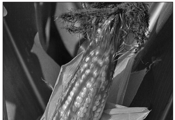
Grundnahrungsmittel: Kartoffeln, Mais, Reis