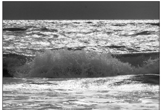
Die Weltmeere: Wie sieht es unter dem Meeresspiegel aus?

Aktualisierungen finden Sie auch im Internet unter www.erdkunde-medien.de