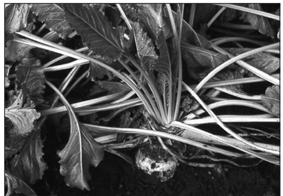
Zuckerrüben – Hauptlieferant unseres Zuckers