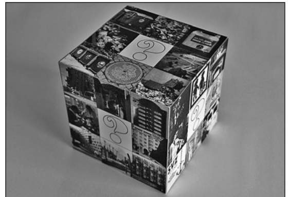
Wie “funktioniert” eine Stadt? Entscheidungs- und Erzählwürfel

Aktualisierungen finden Sie auch im Internet unter www.erdkunde-medien.de