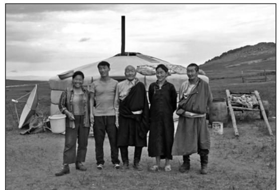
Noch sind die meisten Menschen in der Mongolei Nomaden.