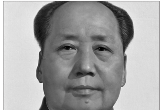
Mao: Er bestimmte das Schicksal Chinas und seiner Bewohner.