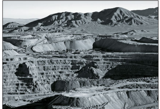
Chuquicamata, der größte Kupfertagebau der Erde

Kupfer ist ein weltweit stark nachgefragter Rohstoff. Der Kupferpreis ist in den zurückliegenden Jahren stark gestiegen. Die größten Kupfervorkommen gibt es in Chile. Dort liegt auch der größte Kupfertagebau der Erde: Chuquicamata.