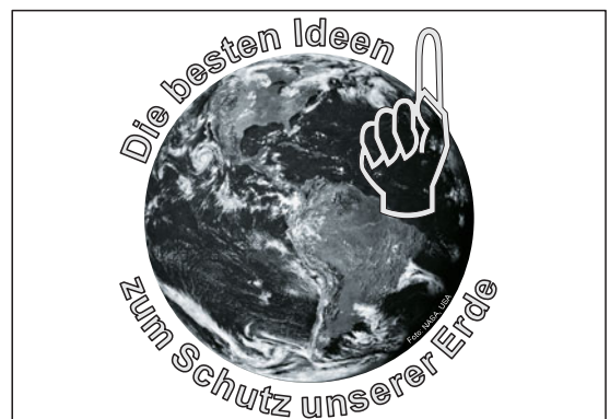
Unsere Erde braucht unseren Schutz