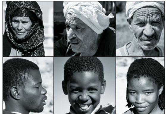
Menschen verschiedener Rassen in Afrika

Tropische Regenwälder, Savannen und Wüsten – so präsentiert sich Afrika